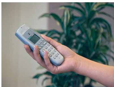
clino call DECTplus

Hinweis: Die Textdaten und Feindaten können unter www.ackermann-clino.de im Bereich Presse, Stichwort „Pressemitteilungen“, heruntergeladen werden.